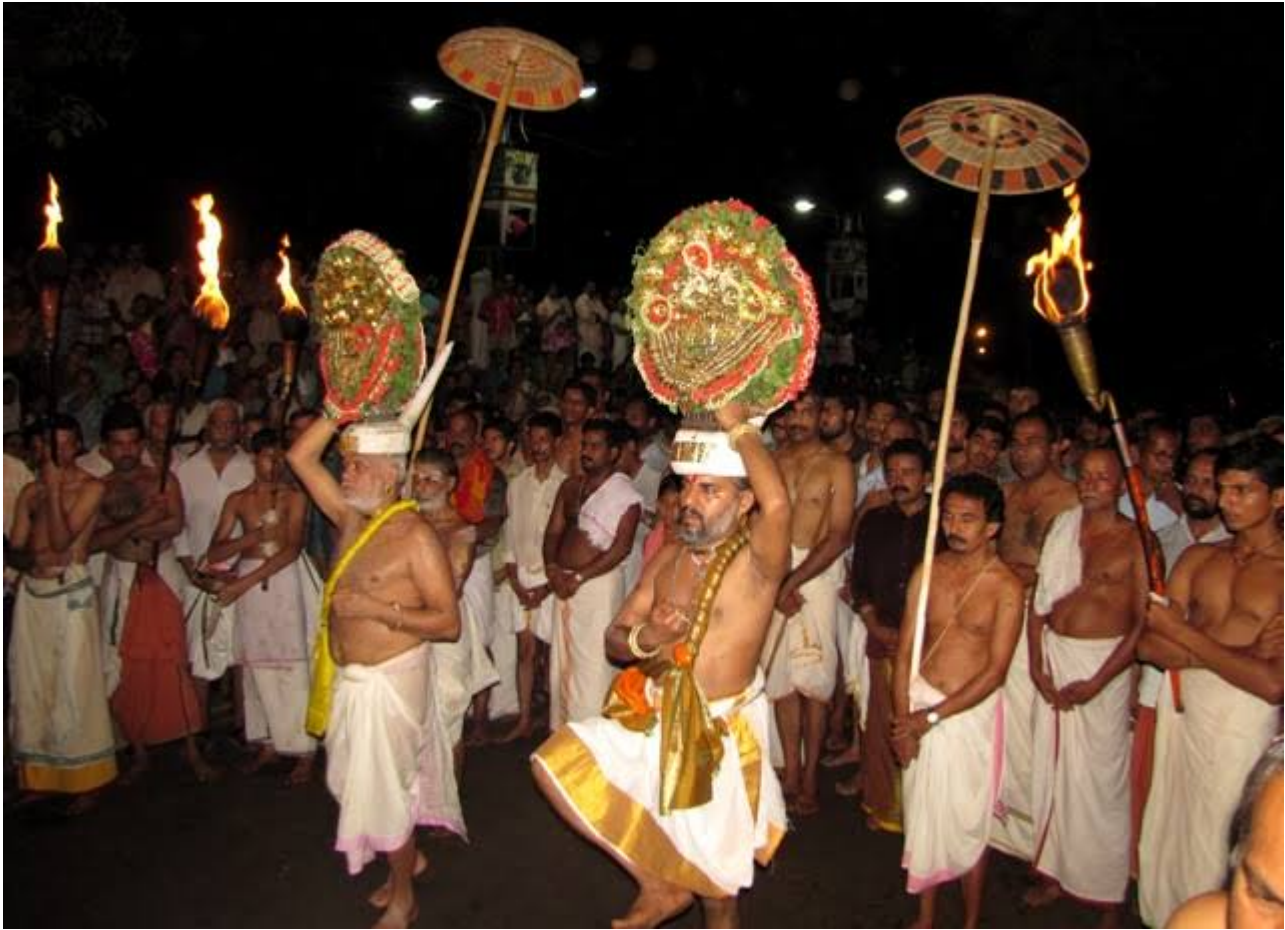
A devotee with skin disease was sitting under this tree and when ilanji fruit was falling he felt immense pain. Krishna made a promise to the tree that it will not bear fruit and harm his devotee Eventhough Kerala is famous for ulsavam with Elephants, this is a rare Temple, where