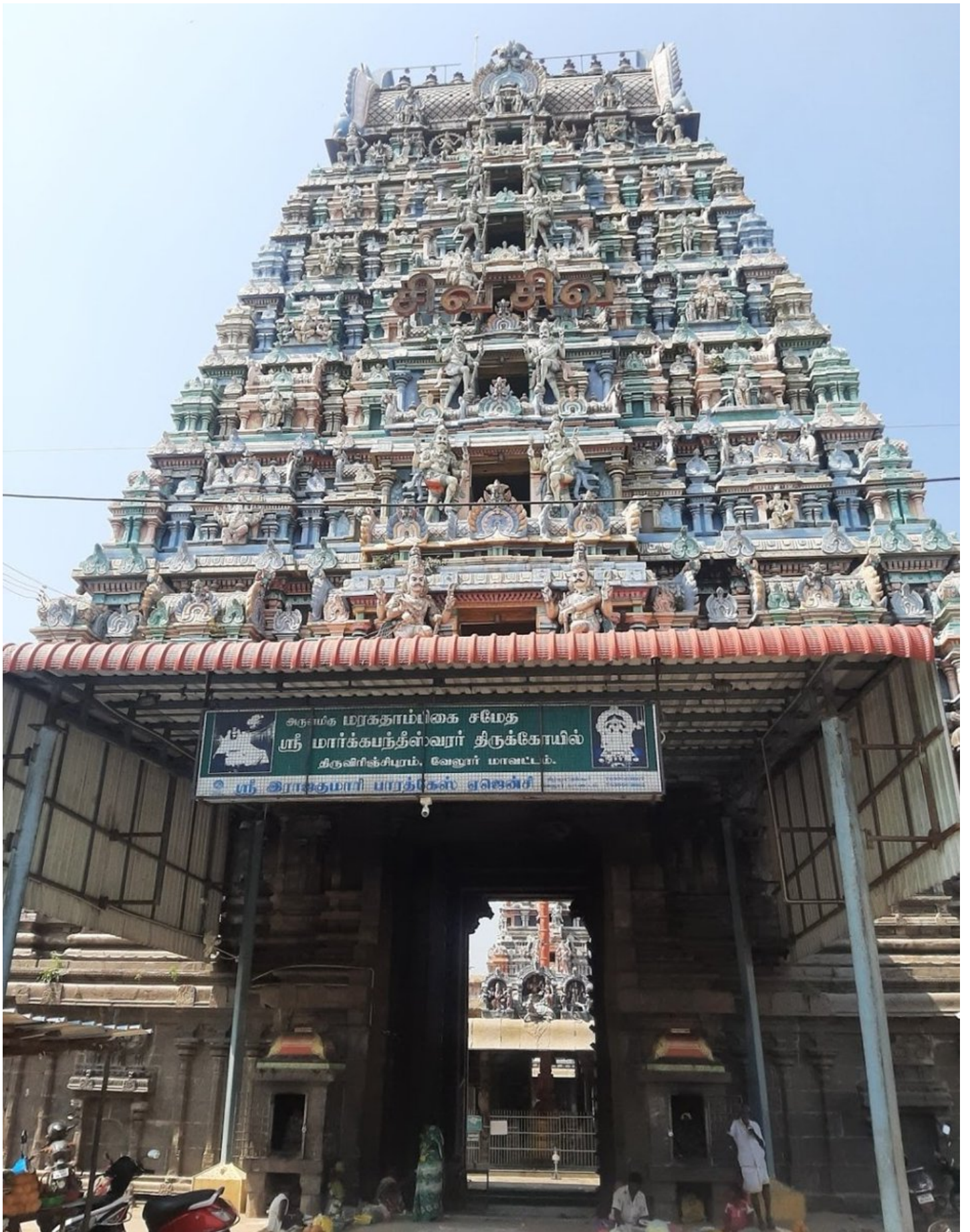
This stotra was written praising Sri Margabandheswarar, Virinjipuram, Near Vellore, TN - Magnificent & very ancient temple famous for its compound wall/ Madhil azhagu-has minute stone carvings all around. This place gets its name-Virinjiapuram as Brahma(Virinchi)worshiped Siva here