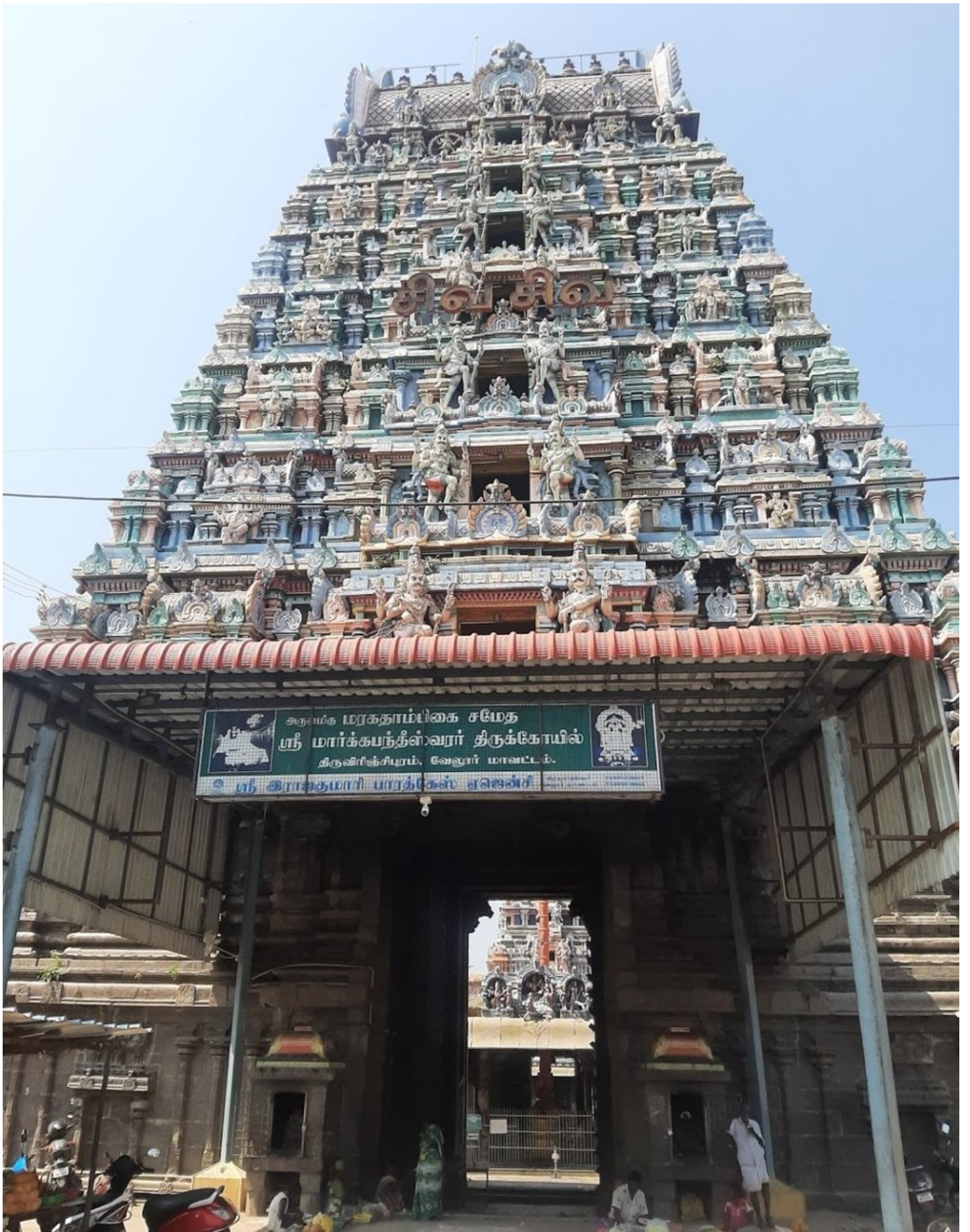
This stotra was written praising Sri Margabandheswarar, Virinjipuram, Near Vellore, TN - Magnificent & very ancient temple famous for its compound wall/ Madhil azhagu-has minute stone carvings all around. This place gets its name-Virinjipuram as Brahma(Virinchi)worshiped Siva here